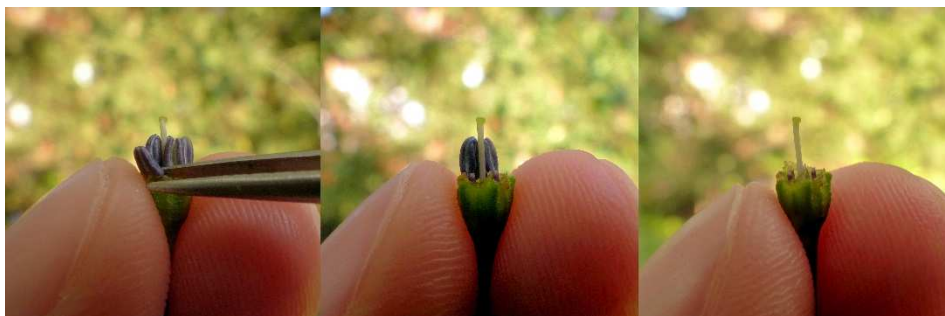
Die Staubbeutel werden – weg vom Griffel – einzeln entfernt. Mitte: Noch zwei von fünf sind vorhanden.

Dies ist der Schritt der eigentlichen Kastration, durch die wir die Zwitterblüte zu einer rein weiblichen Blüte machen. Vorsichtig werden mit der Pinzette nacheinander alle Staubbeutel entfernt. Wenn möglich, greift die Pinzette am Staubfaden und reißt diesen mitsamt den Staubbeuteln ab. Fassen wir direkt den Staubbeutel, müssen wir aufpassen, dass wir ihn nicht beschädigen und dadurch unter Umständen für Pollenaustritt sorgen. Natürlich muss auch der Griffel unversehrt bleiben. Soll die folgende Bestäubung erst am nächsten Tag stattfinden, kann die kastrierte Blüte bereits jetzt vorübergehend isoliert werden (siehe Punkt 9 – Isolation).