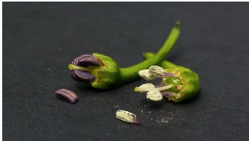
Die Staubbeutel der linken Blüte haben noch keinen Pollen freigegeben, während die der rechten längst mit der Ausschüttung begonnen haben (Kronblätter jeweils entfernt).

Nun suchen wir an der Pflanze, die als „Mutter“ verwendet werden soll (also später die Früchte mit den gekreuzten Samen trägt) Blütenknospen im passenden Stadium. Das sollten Knospen am Tag vor ihrem Aufblühen sein. Mit etwas Beobachtung bekommt man schnell einen Blick dafür. Wichtig ist, dass die Staubbeutel noch keinen Pollen schütten, da sonst vermutlich bereits eine Selbstbestäubung stattgefunden hat. An der Pflanze, die als „Vater“ verwendet werden soll, suchen wir eine oder mehrere möglichst frisch geöffnete Blüten, die mit der Pollenausschüttung begonnen haben. Wer ganz sichergehen will, dass in diesen Blüten kein unerwünschter fremder Pollen hinterlassen wurde und noch genug eigener Pollen vorhanden ist, muss sie schon vor dem Aufblühen gegen Insektenbesuch schützen.