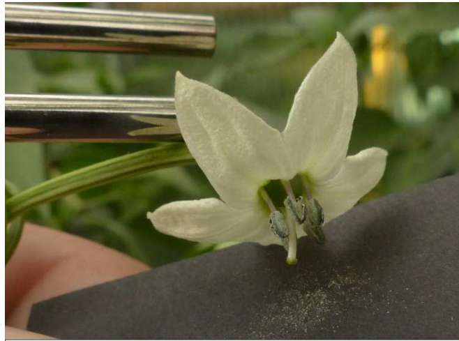
Pollen wird – unterstützt durch die Vibration der Stimmgabel – auf das dunkle Papier ausgeschüttet, von dem er sich optisch gut abhebt. (Kronblätter jeweils entfernt).