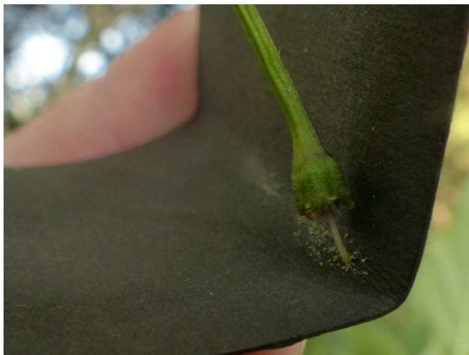
Pollen wird – unterstützt durch die Vibration der Stimmgabel – auf das dunkle Papier ausgeschüttet, von dem er sich optisch gut abhebt. (Kronblätter jeweils entfernt).

Nun wird der gesammelte Pollen auf die kastrierten Blüten übertragen. Vorsichtig taucht man den vorderen Teil des Griffels (die Narbe) in den Blütenstaub, der sich auf dem Papier oder dem „gepflückten“ Staubbeutel befindet. Dabei kann beobachtet werden, wie der Pollen an der Narbe haften bleibt.