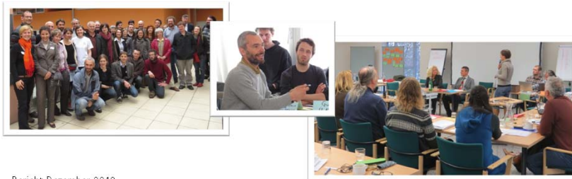
Bericht Dezember 2013

„Our Agro Biodiversity“ – Grundtvig Projekt mit Polen, Rumänien, Lettland, Schweiz 3 Internationale Workshops zur Saatgutverordnung mit NGOs aus ganz Europa