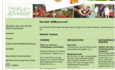
Bericht Dezember 2013