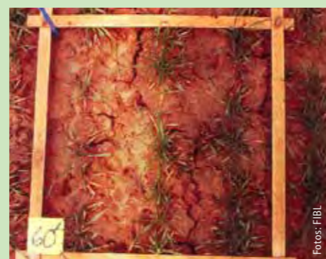
Konventionell bewirtschaftete Parzelle