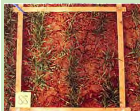
Biologisch bewirtschaftete Parzelle