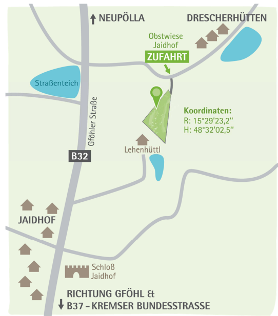
Zufahrt zur Obstsortenerhaltungswiese Jaidhof