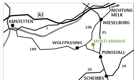
Lage der Obstsortenerhaltungswiese Mostlandhof

Koordinaten: R: 15°06'44,2"; H: 48°05'03,2"