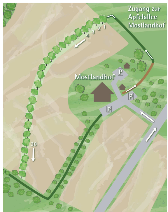
Übersichtsplan der Obstsortenerhaltungswiese Mostlandhof

Die ARCHE NOAH Pflaumensammlung ist eingebettet in umfangreichen Obstalleen des Mostlandhofs. Die genaue Position der Patenbäume ist vor Ort beschrieben, bzw. können sie sie im Gasthaus erfragen. Die Obstbäume sind mit einem Schild gekennzeichnet, auf dem die Sorte und der Name der Obstbaumpatin/des Obstbaumpaten angeführt sind. Auf Ihrer Obstbaumpatenschafts-Urkunde finden Sie neben dem Sortennamen auch die Baumnummer. 2016 wurden die ersten Bäume gepflanzt, in den nächsten Jahren werden weitere Bäume hinzu kommen. Die leichte Hangfläche ist mit ihrem lehmhaltigen, gut wasserversorgten Boden ideal für Pflaumenarten geeignet. Die Fläche und die Bäume werden von ARCHE NOAH und dem Grundbesitzer nach den Grundsätzen der biologischen Landwirtschaft gepflegt.