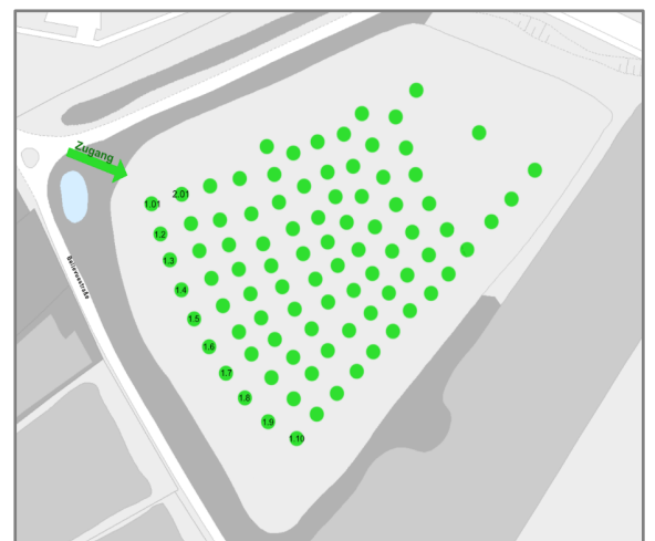
Übersichtsplan der Obstwiese „am Himmel“

Mit dem Auto entweder über die Höhenstrasse oder direkt aus Wien über Grinzing und der Himmelstrasse entlang bis zum Parkplatz Bellevuiewiese. Von dort noch ca. 350m Fussweg Koordinaten: 48.260562°N 16.315834°E