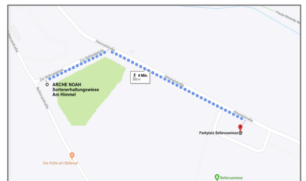
Lage der Obstsortenwiese „Am Himmel“