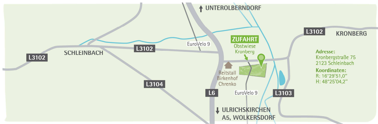
Zufahrt zur Obstsortenerhaltungswiese Kronberg